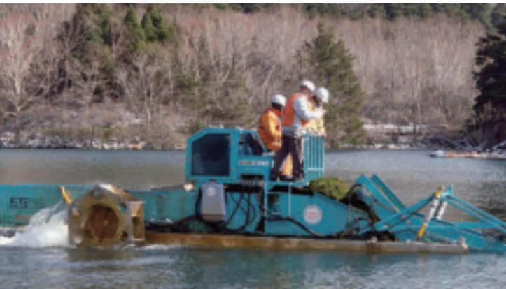
諏訪湖における実証試験では、刈取り船の回収量は人力の約10倍だそうです!!

刈取り船が、あつという間に大量の水草を刈り取る様子に、参加者からは驚きの声が上がっていました！