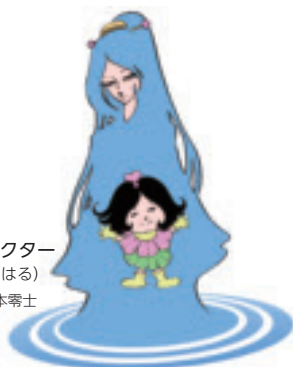
「湖美来」イメージキャラクター 水恋(すいれん)と湖春(こはる) ©松本零士