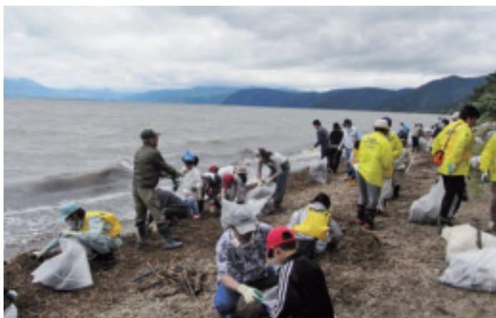
家族で参加した子ども達もがんばりました！

234名の参加者が、舟津浜に漂着したヨシ屑、ごみを時間も忘れて熱心に回収しました。回収したヨシ屑、ゴミは8.9トン！