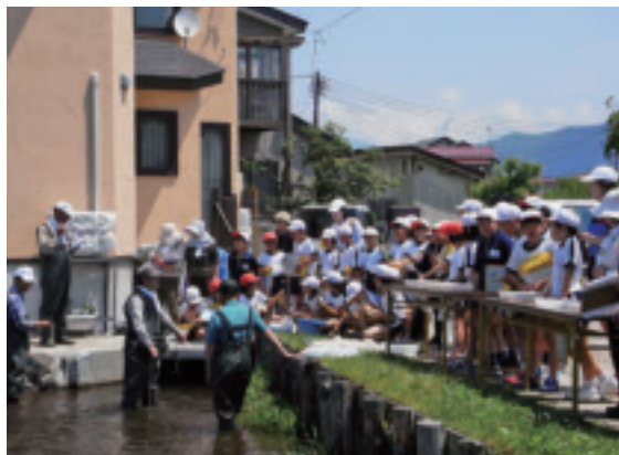
みんな川の水質の話に熱心に耳を傾けていました。

まだ少し冷たかった川に入って生き物を探したり、大茂田川の自然を守る会の方々の話に耳を傾けたり、参加した子ども達はみんなきらきらと目を輝かせていました。