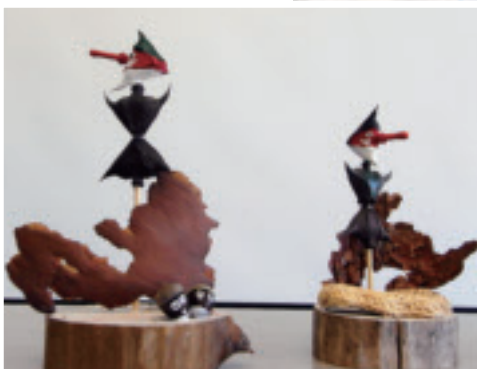
ヒシの実を使った天狗のかざり。天狗は火伏せの神様といわれます。