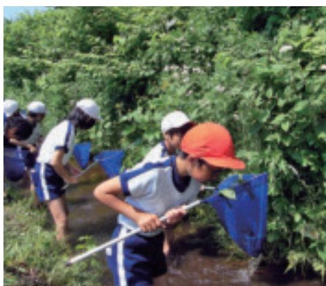
どんな生き物がいるんだろう？

6月8日、猪苗代小学校4年生が参加し、大茂田川上流から中流、下流まで水の様子や、すんでいる生き物を観察しました。