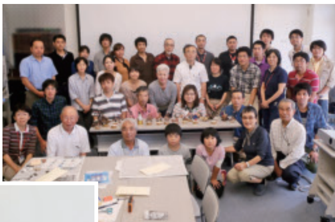
力作を前に記念写真。

午後は、猪苗代町の「学びいな」でヒシの学習とヒシの実を使った工作教室を開催しました。大人も子供もヒシの実工作を楽しんで、たくさんのお土産作品ができました。