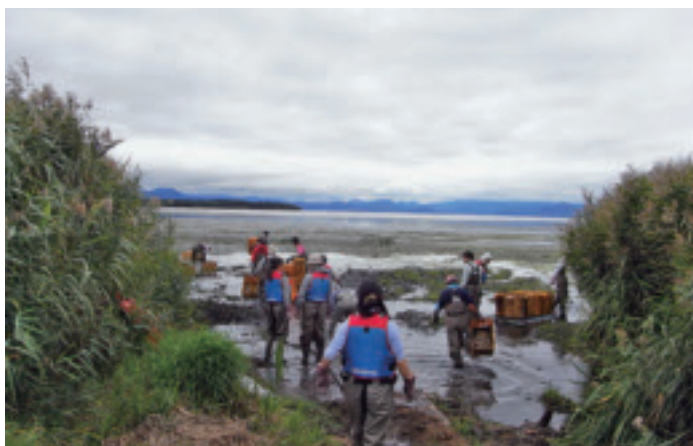
足下がぬかるんで大変な作業でした。