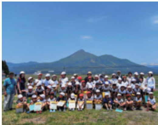
美しい磐梯山を背に記念写真！