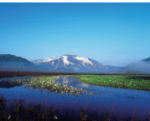
至仏山と尾瀬ヶ原に咲く水芭蕉

A 福島県は、磐梯朝日国立公園、尾瀬国立公園、日光国立公園の三つの国立公園がある自然が豊かなところです。いつまでもこの自然を残していくためには、皆さんの協力が欠かせません。猪苗代湖の保全活動を始め、各地で保全活動はたくさん行われていますので、ぜひ参加して、福島県の自然保全の一翼を多くの人に担ってほしいです。