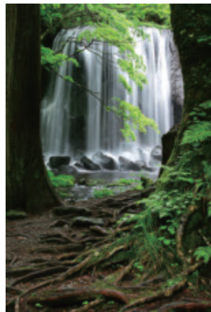
優秀賞 「鼓動」 菅野 美子

Photo Contest 第10回猪苗代湖・裏磐梯湖沼 フォトコンテスト入賞作品